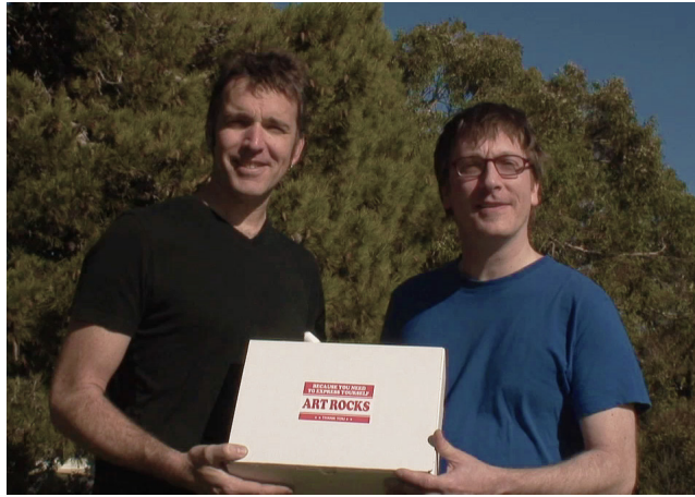
JEFF&GORDON Art Rocks, 2011 Photo: JEFF&GORDON

En résonance avec le climat social actuel, le projet Art Rocks propose aux visiteurs une trousse de manifestation. Une vidéo promotionnelle autoproduite par JEFF&GORDON explique aux participants comment utiliser les objets d'un boîtier dans le but de faire entendre leur voix auprès des politiciens. Moins cher que de payer un repas à son député à l'Assemblée nationale, la trousse de manifestation sera en vente à l'Œil de Poisson. Geste conceptuel, Art Rocks détourne également les codes publicitaires pour explorer la limite ténue entre le produit de consommation et l'objet artistique.