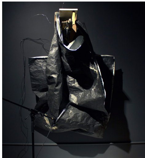
Camille Bernard-Gravel Éole (détail), 2015

VERNISSAGE 8 MAI — 20H RENCONTRE AVEC L'ARTISTE — 19H30