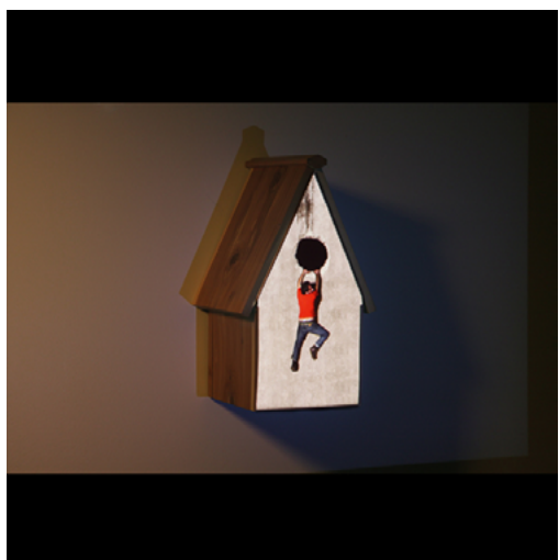
Cuckoo (détail), 2010

Correspondence [Petite galerie et Entrée vidéo]